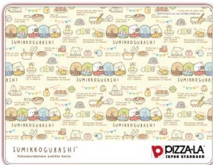
約25cm × 33cm ※プラスチック製

©2018 San-X Co., Ltd. All Rights Reserved.