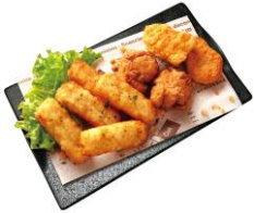
<トリプルミックス>