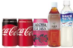
<お好きなソフトドリンク>

※対象商品同士のハーフ&ハーフもOKです ※クーポンとの併用はできません ※インターネットからのご注文はピザーラ公式サイトでのみご利用頂けます ※「トリプルミックス」の単品売価は440円(税抜)です